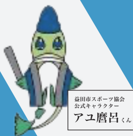
益田市スポーツ協会 公式キャラクター アユ麿呂くん